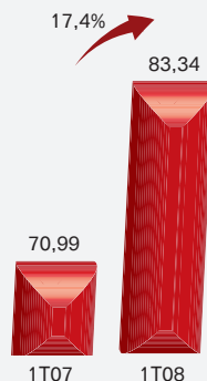
Preço Médio (R$ / MWh)